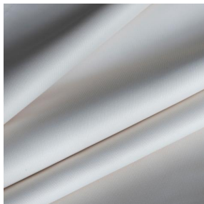
BIOTAM Ivoire 02