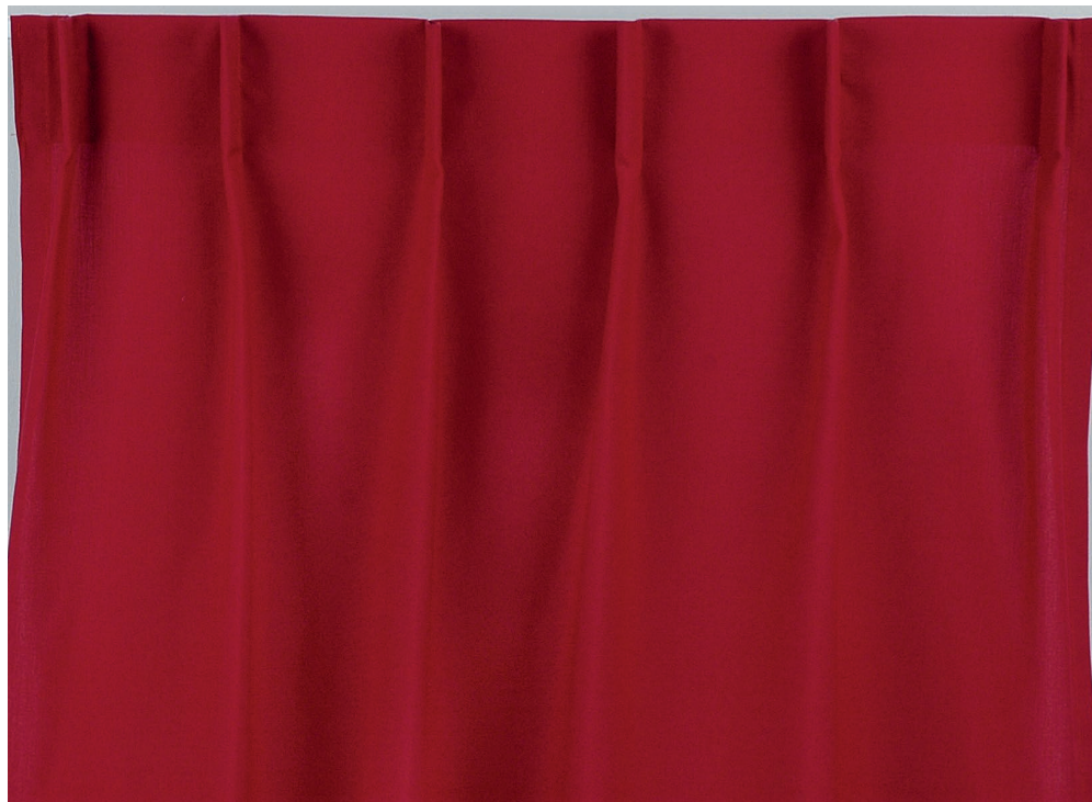
vue de dos